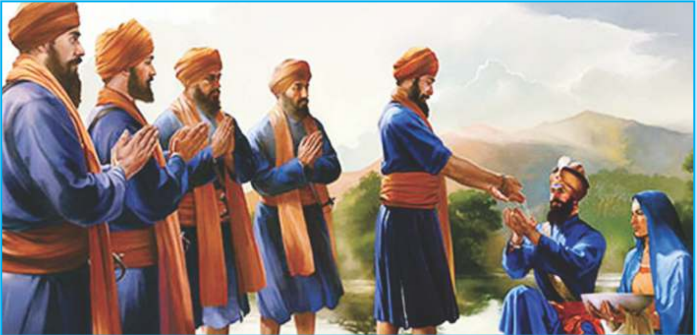
ਤਖ਼ਤ ਸ੍ਰੀ ਕੇਸਗੜ੍ਹ ਸਾਹਿਬ ਸ੍ਰੀ ਅਨੰਦਪੁਰ