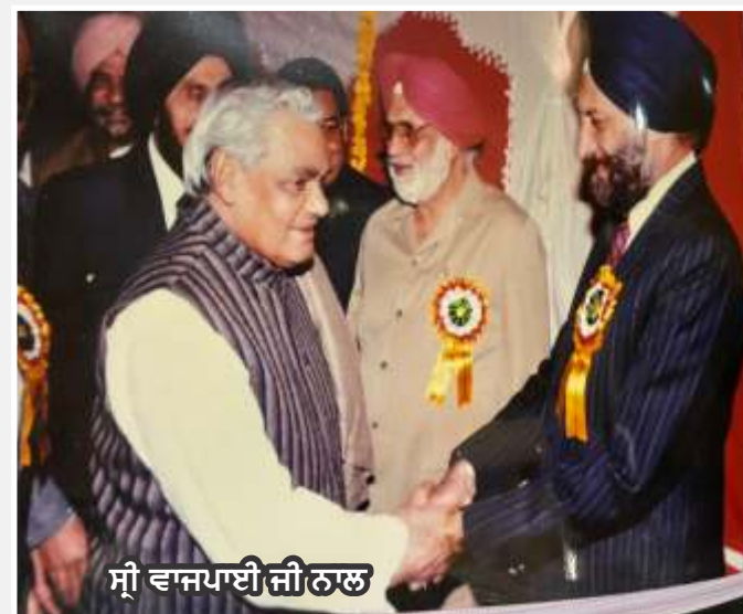
ਸ੍ਰੀ ਵਾਜਪਾਈ ਜੀ ਨਾਲ

ਲਈ ਆਖਿਆ ਪਰ ਸ੍ਰ:ਚੌਟਾਲਾ ਨੇ ਸਿਫਾਰਸ਼ ਕਰਨ ਦੀ ਥਾਂ ਹਰਿਆਣੇ ਦੇ ਆਪਣੇ ਕੋਟੇ ਵਿਚੋਂ ਇਕ ਸੀਟ ਸ੍ਰ:ਤਰਲੋਚਨ ਸਿੰਘ ਜੀ ਨੂੰ ਦਿੰਦਿਆਂ ਇਨ੍ਹਾਂ ਨੂੰ ਰਾਜ ਸਭਾ ਦਾ ਮੈਂਬਰ ਬਣਾ ਦਿੱਤਾ। ਹਾਲਾਂ ਕਿ ਇਹ ਸੱਚ ਸਾਰੇ ਜਾਣਦੇ ਸਨ ਕਿ ਸ੍ਰ:ਤਰਲੋਚਨ ਸਿੰਘ ਲਈ ਸਿੱਖ ਪੰਥ ਤੇ ਪੰਜਾਬੀਅਤ ਏਥੋਂ ਤੱਕ