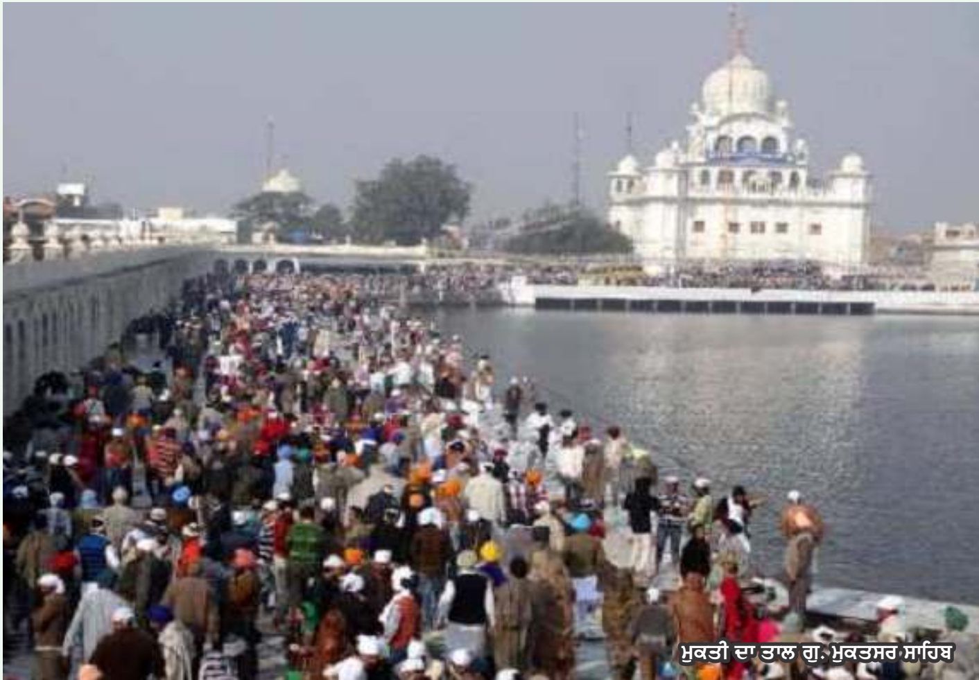
ਮੁਕਤੀ ਦਾ ਤਾਲ ਗੁ. ਮੁਕਤਸਰ ਸਾਹਿਬ

ਬੇਦਾਵਾ' ਉਰਦੂ-ਫਾਰਸੀ ਦਾ ਸ਼ਬਦ ਹੈ ਜਿਸ ਦੇ ਅਰਥ ਹਨ ਕਿਸੇ ਦਾ ਅਵੇ ਦਾ ਤਿਆਗ। ਕਿਸੇ ਮਲਕੀਅਤ ਜਾਂ ਹਕੂਕ ਤੋਂ ਬੇਦਖਲ ਕਰਨਾ। ਭਾਸ਼ਾ ਦੇ ਅਰਥ-ਵਿਸਥਾਰ ਅਨੁਸਾਰ ਅੱਜ ਕਲ ਇਸ ਦੇ ਅਰਥ ਕਿਸੇ ਨੂੰ ਪਿੱਠ-ਵਖਾਉਣਾ, ਮਦਦ ਕਰਨ ਸਮੇਂ ਐਨ ਮੌਕੇ ਤੇ ਖਿਸਕ ਜਾਣਾ ਵੀ ਕਰ ਲਿਆ ਜਾਂਦਾ ਹੈ।