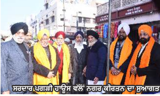
ਸਰਦਾਰ ਪਗੜੀ ਹਾਊਸ ਵਲੋਂ ਨਗਰ ਕੀਰਤਨ ਦਾ ਸੁਆਗਤ