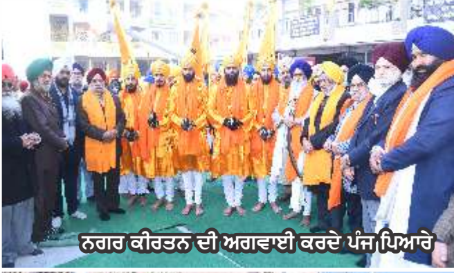
ਨਗਰ ਕੀਰਤਨ ਦੀ ਅਗਵਾਈ ਕਰਦੇ ਪੰਜ ਪਿਆਰੇ