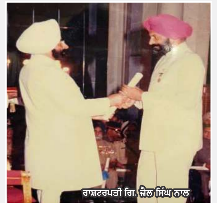
ਰਾਸ਼ਟਰਪਤੀ ਗਿ. ਜ਼ੈਲ ਸਿੰਘ ਨਾਲ