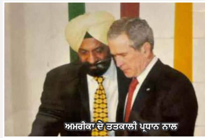
ਅਮਰੀਕਾ ਦੇ ਤਤਕਾਲੀ ਪ੍ਰਧਾਨ ਨਾਲ

ਲਈ ਆਖਿਆ ਪਰ ਸ੍ਰ:ਚੌਟਾਲਾ ਨੇ ਸਿਫਾਰਸ਼ ਕਰਨ ਦੀ ਥਾਂ ਹਰਿਆਣੇ ਦੇ ਆਪਣੇ ਕੋਟੇ ਵਿਚੋਂ ਇਕ ਸੀਟ ਸ੍ਰ:ਤਰਲੋਚਨ ਸਿੰਘ ਜੀ ਨੂੰ ਦਿੰਦਿਆਂ ਇਨ੍ਹਾਂ ਨੂੰ ਰਾਜ ਸਭਾ ਦਾ ਮੈਂਬਰ ਬਣਾ ਦਿੱਤਾ। ਹਾਲਾਂ ਕਿ ਇਹ ਸੱਚ ਸਾਰੇ ਜਾਣਦੇ ਸਨ ਕਿ ਸ੍ਰ:ਤਰਲੋਚਨ ਸਿੰਘ ਲਈ ਸਿੱਖ ਪੰਥ ਤੇ ਪੰਜਾਬੀਅਤ ਏਥੋਂ ਤੱਕ