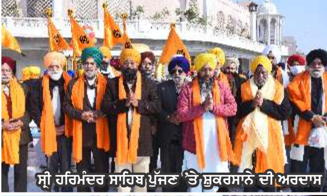
ਸ੍ਰੀ ਹਰਿਮੰਦਰ ਸਾਹਿਬ ਪੁੱਜਣ 'ਤੇ ਸ਼ੁਕਰਸਾਨੇ ਦੀ ਅਰਦਾਸ