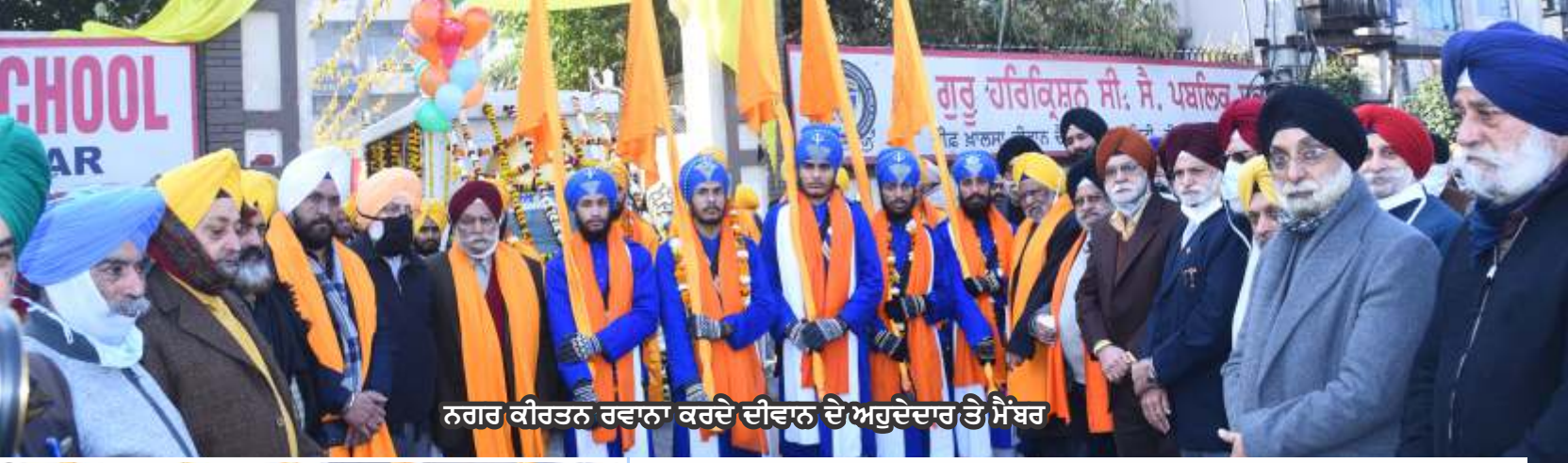
ਨਗਰ ਕੀਰਤਨ ਰਵਾਨਾ ਕਰਦੇ ਦੀਵਾਨ ਦੇ ਅਹੁਦੇਦਾਰ ਤੇ ਮੈਂਬਰ