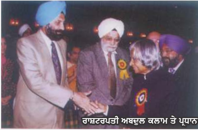
ਰਾਸ਼ਟਰਪਤੀ ਅਬਦੁਲ ਕਲਾਮ ਤੇ ਪ੍ਰਧਾਨ ਮੰਤਰੀ ਸ. ਮਨਮੋਹਨ ਸਿੰਘ ਜੀ ਨਾਲ