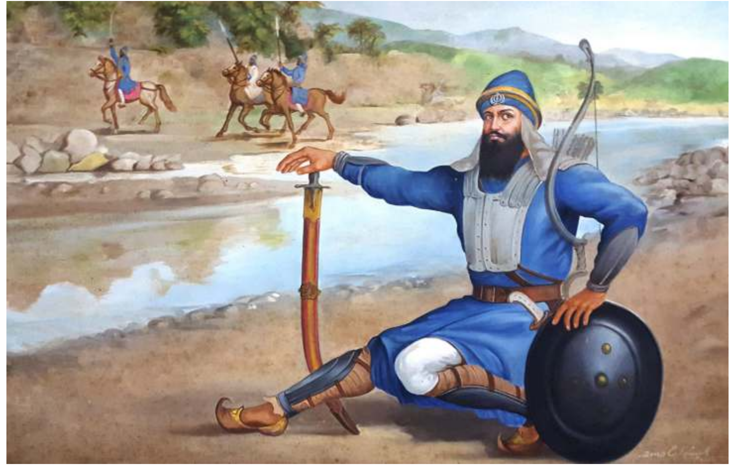
ਪ੍ਰੋਫੈਸਰ ਤੇ ਮੁਖੀ, ਸਿੱਖ ਵਿਸ਼ਵਕੋਸ਼, ਪੰ.ਯੂ.ਪਟਿਆਲਾ

ਗੋਬਿੰਦ ਸਿੰਘ ਜੀ ਨੇ ਉਸੇ ਨੂੰ ਹੀ ਸਾਕਾਰ ਰੂਪ ਪ੍ਰਦਾਨ ਕਰਨ ਵਿਚ ਭੂਮਿਕਾ ਨਿਭਾਈ ਸੀ। ਇਸੇ ਉਦੇਸ਼ ਅਧੀਨ ਹੀ ਗੁਰੂ ਗੋਬਿੰਦ ਸਿੰਘ ਜੀ ਨੇ ਬੰਦਾ ਸਿੰਘ ਬਹਾਦਰ ਨੂੰ ਨਾਦੇੜ ਤੋਂ ਪੰਜਾਬ ਭੇਜਿਆ ਸੀ।