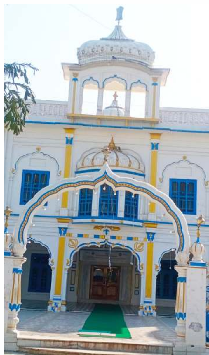
ਗੁਰਦੁਆਰੇ ਦੀ ਬਾਹਰੀ ਦਿਖ

ਉਤਰ:- ਮੇਰਾ ਪਿਤਾ ਜੀ ਦਾ ਅਤੇ ਸੰਤ ਜੀ ਦਾ ਆਤਮਿਕ-