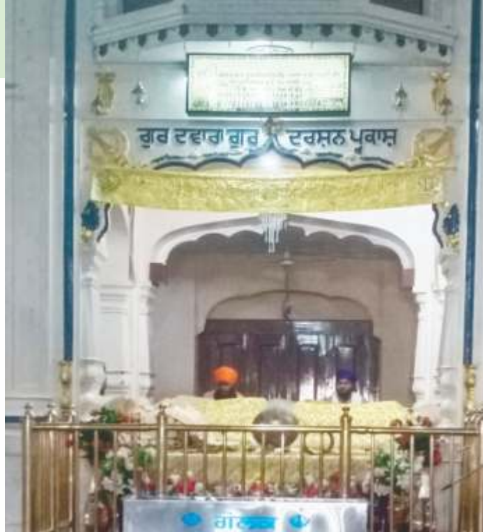
ਗੁਰਦੁਆਰਾ ਗੁਰਦਰਸ਼ਨ ਪ੍ਰਕਾਸ਼